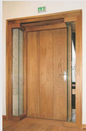
Eingang 1. OG

Zentrum für Kirchenmusik der Evangelischen Kirchen in Mitteldeutschland