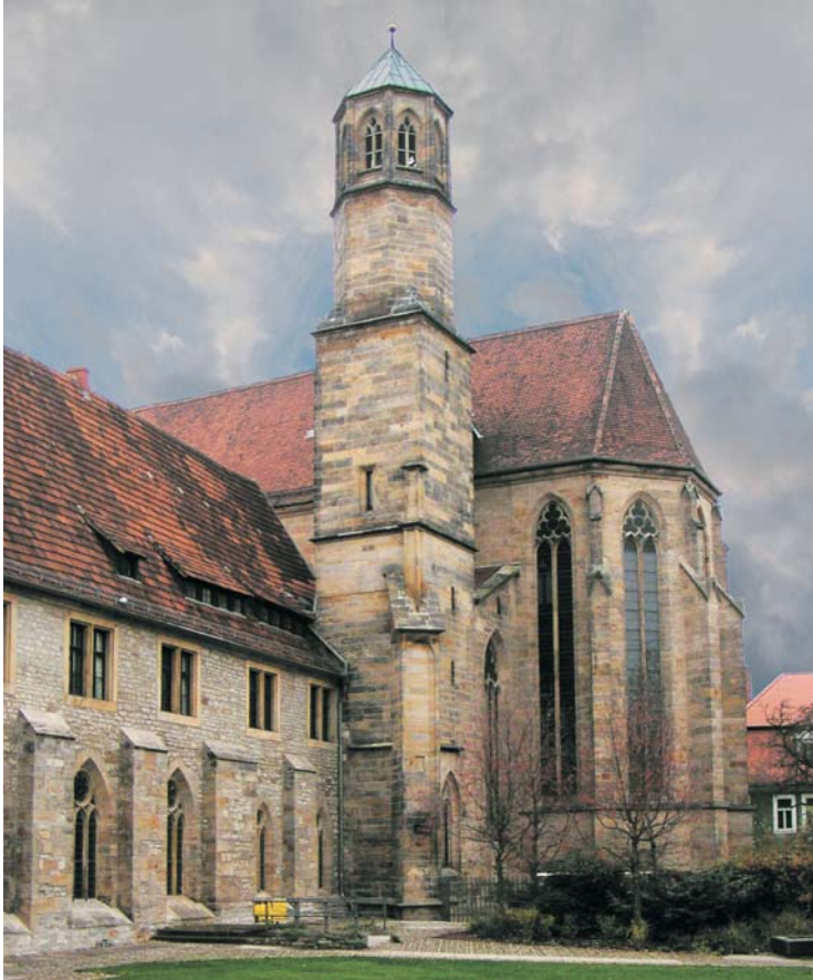
Ostfassade des Klosters mit Turm und Chor der Predigerkirche

gefördert durch die Beauftragte der Bundesregierung für Kultur und Medien