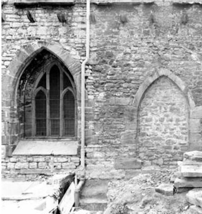
Ehemaliger Zugang Kapitelsaal 1996