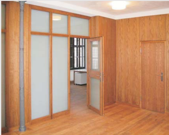
Foyer des Zentrums für Kirchenmusik