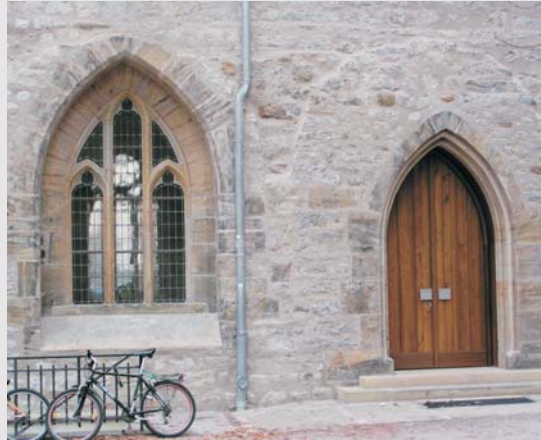
Neue Eingangstür zum Kapitelsaal 2004