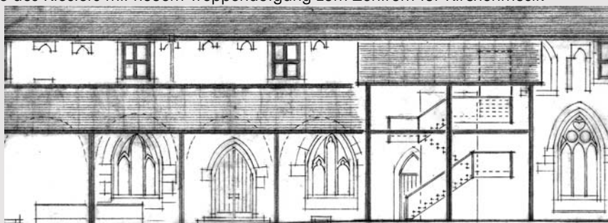
Neues Treppenhaus mit geplantem Wiederaufbau des Kreuzgangs

Der Zugang zum historischen Dachstuhl erfolgt über eine neue Innentreppe am Nordgiebel im Obergeschoss.