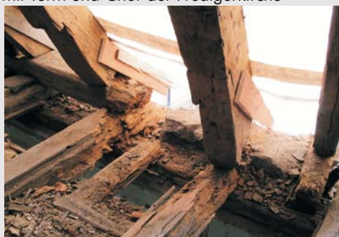
Dachstuhl von 1278 - Holzschäden

Das Erdgeschoss mit Kapitelsaal und Refektorium sowie das Kellergeschoss werden für vielfältige kirchliche und öffentliche Veranstaltungen genutzt.