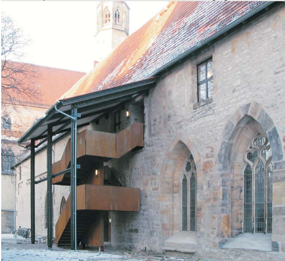
Westfassade des Klosters mit neuem Treppenaufgang zum Zentrum für Kirchenmusik

Zentrum für Kirchenmusik der Evangelischen Kirchen in Mitteldeutschland